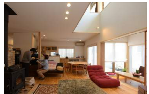
住まいのそこかしこにくつろぎの居場所が。個々の時間にもつながり合える空間は、大人の暮らしにも心地良い。

音楽好きのご主人は、真空管アンプでレコードを日常的に楽しまれており、取材日も山口百恵やサザンが家じゅうに響きました。珪藻土壁は、その無数の穴で音の反響が抑えられ、音がキレイに響くという効果も！