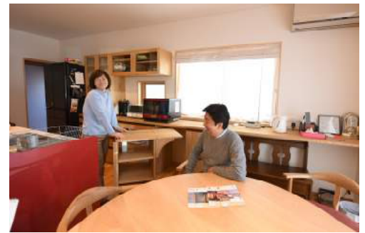
娘さんが選んだ赤のキッチンがキーカラー。背面収納は一部が可動式の作業台で、皆で料理するときにも重宝。

奥様 私は仕事で帰りが遅いことが多いですが、角を曲がって我が家の灯かりを見ると、一日の疲れが癒されるようでホッとします。窓から漏れる光のあたたかさ、昔の家ではなかった新鮮な感覚。この家を建てて良かったなあと感じる瞬間です。