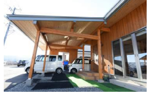
玄関ポーチと合わせた大きなガレージが外観に表情を加える。