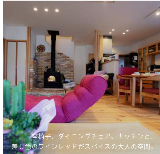
座椅子、ダイニングチェア、キッチンと、差し色のワインレッドがスパイスの大人の空間。